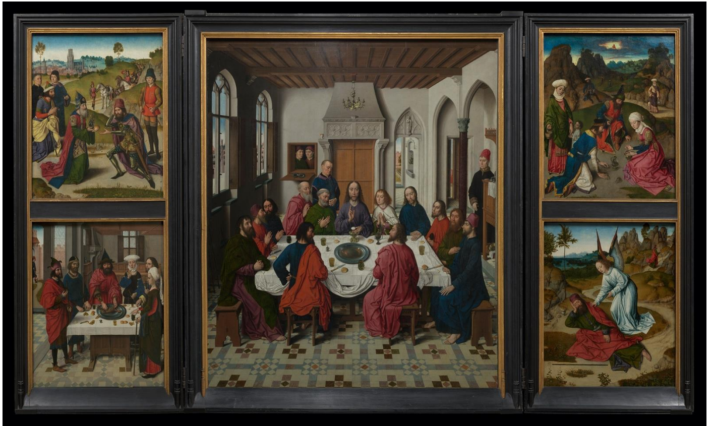
'Triptiek met het Laatste Avondmaal (centrale paneel)', Dieric Bouts, 1464-1468, M Leuven / Sint-Pieterskerk

De 'grand finale' van de tentoonstelling is Het laatste avondmaal van Dieric Bouts. Levenaars kennen het van in de Sint-Pieterskerk, de kerk waarvoor het altaarstuk ook oorspronkelijk geschilderd is. Voor deze tentoonstelling verhuist Bouts' magnum opus tijdelijk naar M Leuven. Dit is namelijk het orgelpunt waarin al de vorige lijnen samenkomen.