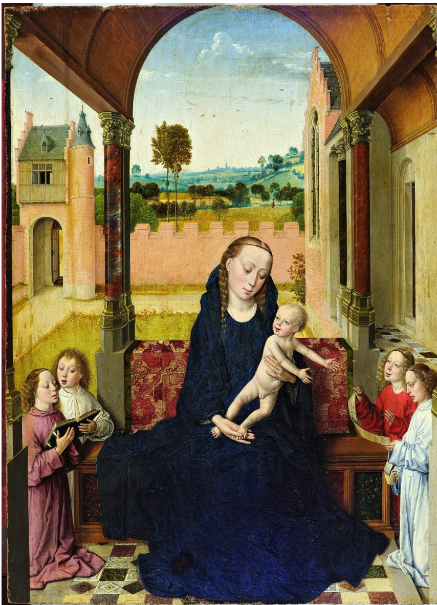
'Maria met Kind en vier engelen', Dieric Bouts, vóór 1469

Als Bouts de handboeken kunstgeschiedenis gehaald heeft, dan heeft dat veel te maken met zijn toepassing van het vluchtpuntperspectief. Samengevat: alle lijnen in een tweedimensionaal werk komen samen in één punt, wat een geloofwaardige illusie van diepte creëert. Bouts was niet de eerste om dit perspectief te gebruiken, maar hij behoorde wel tot de pioniers, samen met bijvoorbeeld Piero della Francesca in Italië.