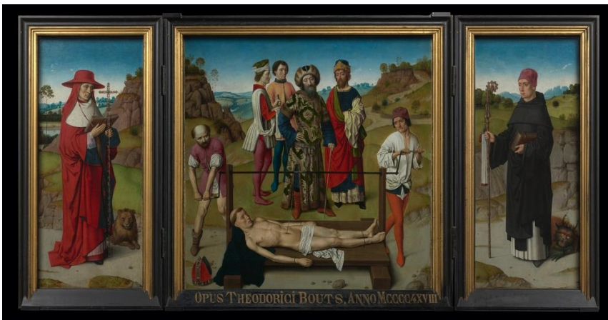
‘Triptiek met de marteling van de heilige Erasmus’, Dieric Bouts, ca. 1460-1464, M Leuven / Sint-Pieterskerk

Tot op vandaag geldt Dieric Bouts (ca.1410-1475) bij het brede publiek als een ‘Vlaamse Primitief van de tweede generatie’ of de ‘schilder van de stilte’. Zijn oeuvre is minder bekend dan dat van pionier Van Eyck en minder instagrammable dan de apocalyptische taferelen van Bosch. Deze tentoonstelling is een imposant eerherstel. Voor het eerst komen bijna twintig van Bouts’ werken samen in Leuven, de stad waar hij een groot stuk van zijn leven doorbracht en waar hij zijn beste panelen schilderde.