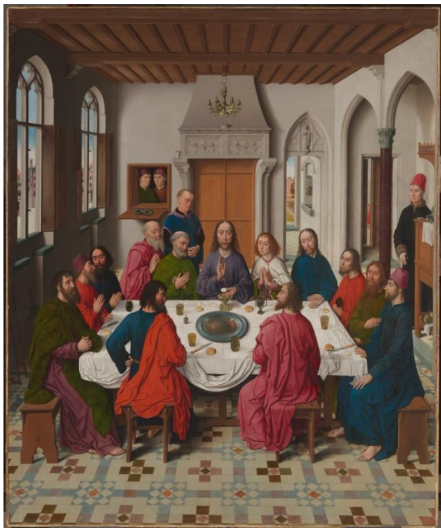
'Het Laatste Avondmaal (centrale paneel)', Dieric Bouts, 1464-1468, M Leuven / Sint-Pieterskerk

Soms staat er wat er staat. De methode van de symbolische lezing is zo ingeburgerd geraakt, dat we in de val dreigen te lopen om elk glas en elk decorlement te interpreteren als iets anders. Bouts werd bijgestaan door theologen om zijn wereld vorm te geven, dus veel van zijn decorstukken zijn absoluut geladen met een dubbele bodem. Maar het is een verademing om hem ook door een andere bril te bekijken: die van de schilder die voorwerpen en gebruiken weergeeft zoals ze er in zijn tijd uitzagen, enkel en alleen om een (voor toen) hedendaagse sfeer te scheppen.