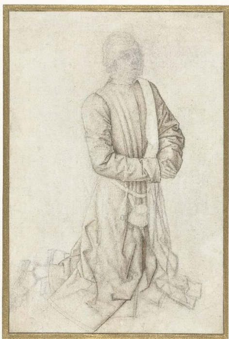
'Studie van een knielende man', (atelier) Dieric Bouts, ca. 1475-1499 (Aankoop uit het F.G. Waller-Fonds)