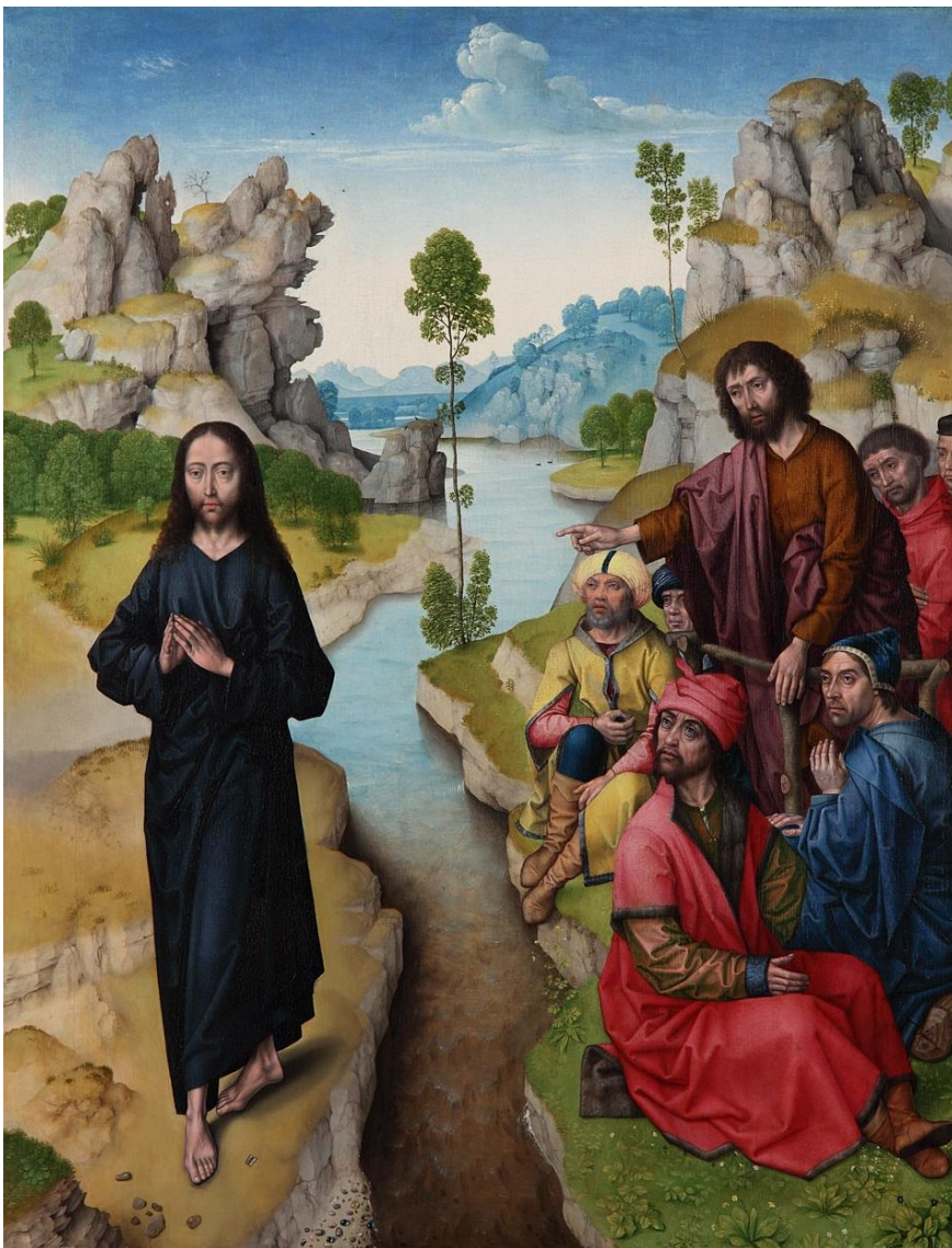
'De prediking van Johannes de Doper ('Ecce Agnus Dei')', Dieric Bouts (volger van), 1500-1520

Dieric Bouts is niet de uitvinder van de landschapsschilderkunst. Er zijn al prachtige voorbeelden te vinden van landschappen in het oeuvre van Jan van Eyck en Rogier Van der Weyden. Maar Bouts gaat absoluut een stap verder. Hij perfectioneert de visuele technieken om diepte te brengen in een landschap, technieken die ook in de rest van Europa verder school zullen maken en nog eeuwen lang tot de basisvaardigheden van elke klassiek geschoolde schilder zullen behoren.