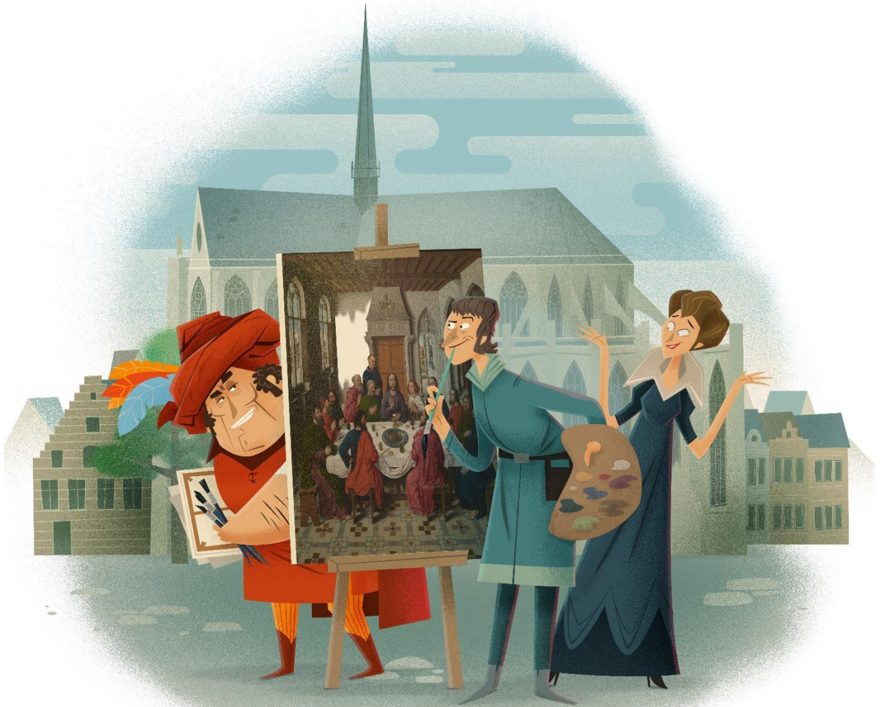
Campagnebeeld 'Dieric Dinges Bouts'