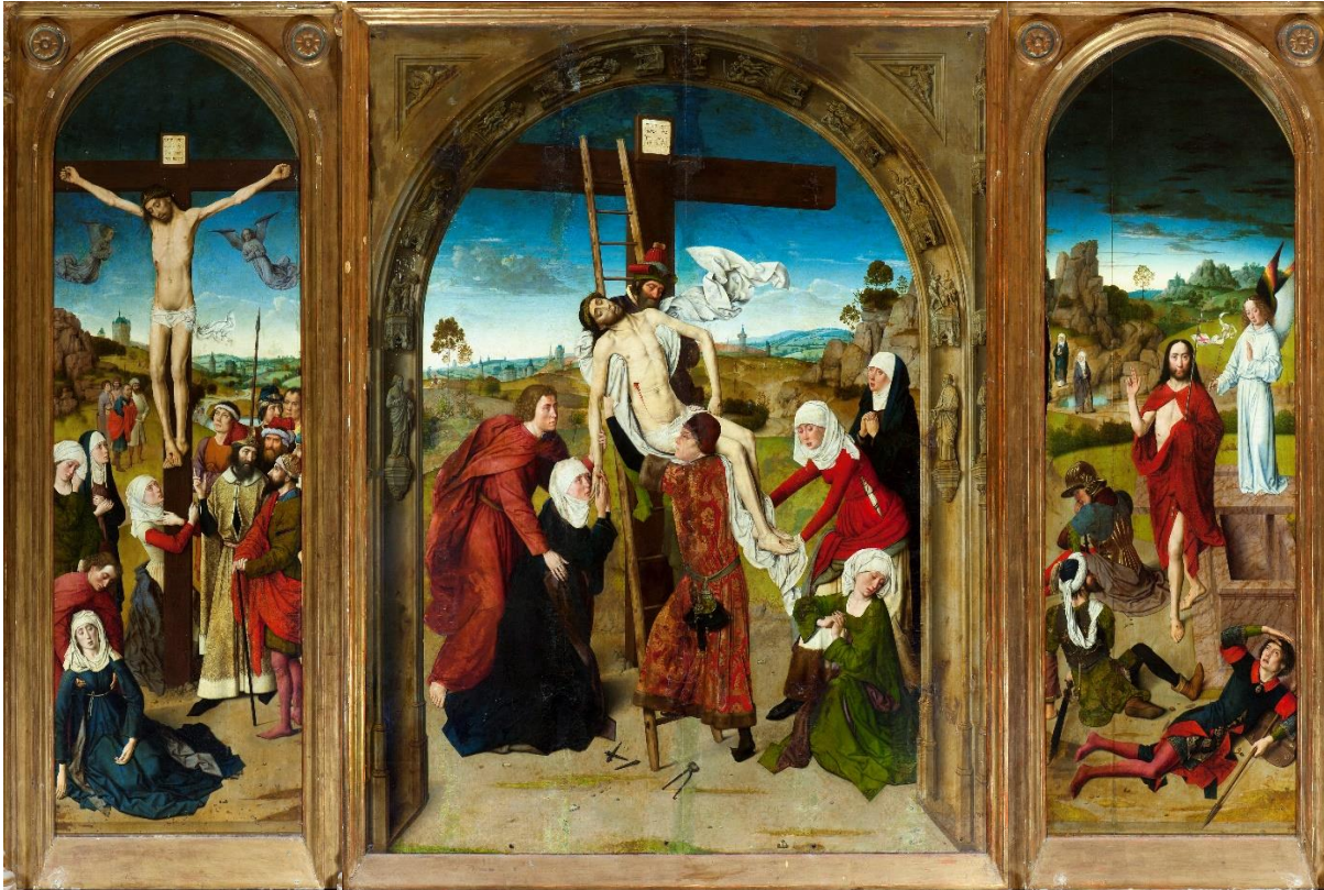
'Triptyk met de Kruisafneming', Dieric Bouts, ca. 1450-1458

Het volstrekt nieuwe gebruik van diepte in de Renaissance, zowel dankzij landschappen als het vluchtpuntperspectief, opent een vat van mogelijkheden. Voor het eerst ontstaat een toneel achter het kader van het schilderij, een scène die gevuld kan worden met personages, voorwerpen, interieurs — eigenlijk met eender wat. Waarvoor kiest Dieric Bouts?